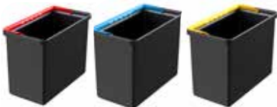
seau - 7 l - anse rouge seau - 7 l - anse bleue seau - 7 l - anse jaune