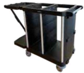
C-Shuttle 350 core 3033035C(M)