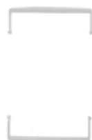
levier bloqué sac 120 l (2 pièces) - gris 4801105