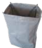
sac plastifié - 50 l - gris 4801098