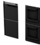
porte gauche 4801069(PL)