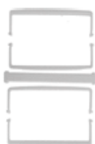
levier bloqué sac (5 pièces) - gris 4801079