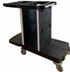
C-Shuttle 250 core avec plate-forme pour DB ou TD 3033026C(M)