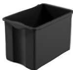
tiroir - 40 l - noir 45 x 29 x 33 cm 4801093