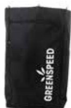
sac - 120 l - noir 4801075