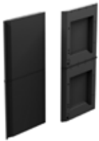
panneau de fermeture arrière 4801066(PL)