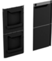
porte droite 4801068(PL)