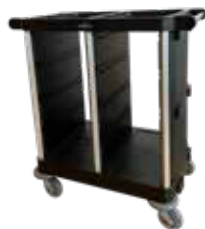
C-Shuttle 250 core 3033025C(M)